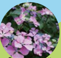
⑳ユングフラウ ウィンドミル