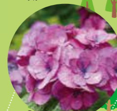
③ボージブーケ スーヅミ