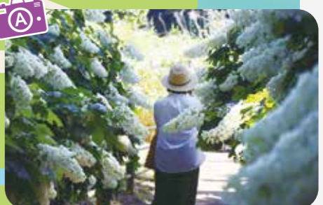
背丈を超えるあじさいが頭上を覆い、アーチのように続くスポット。