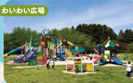
わいわい広場は子どもたちに人気の遊具エリア。