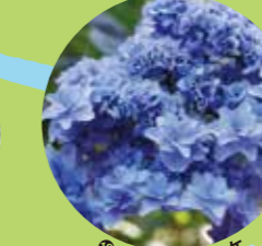
㉒ウエディングブーケ