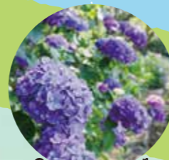
⑱ボージブーケ エビータ