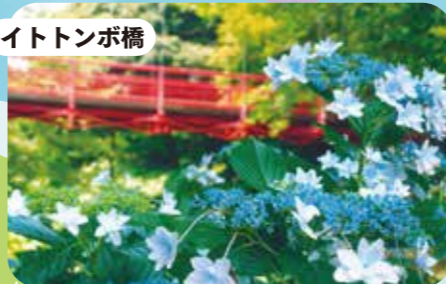
すみだの花火とイトトンボ橋の共演。