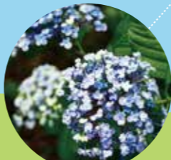
⑲オタフクアジサイ