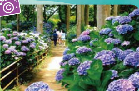
あじさいがしっかりと彩る、静かな散歩路。