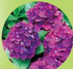
①ファーストレッド