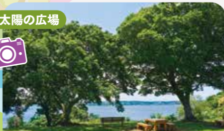
視界が開けて潤沼を一望。パノラマの絶景ポイント。