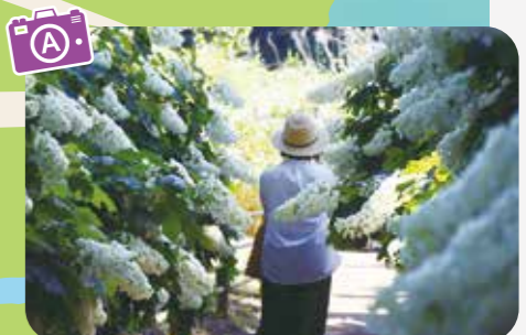
背丈を超えるあじさいが頭上を覆い、アーチのように続くスポット。